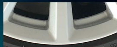
breni DFP™ 500km走行後