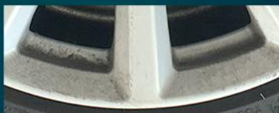
純正パッド500km走行後